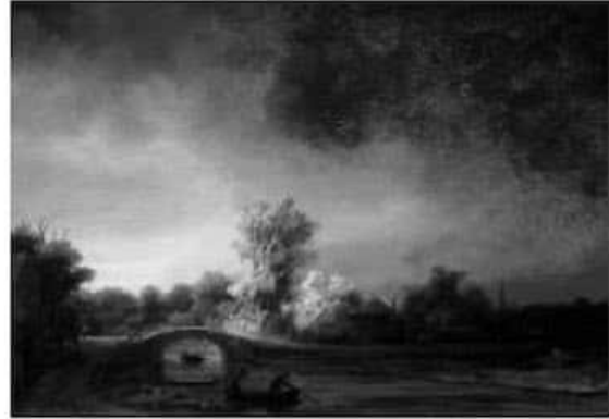
Landschaft mit einer steinernen Brücke, von Rembrandt, um 1638

Werfen wir einen Blick auf dieses Gemälde "Whistlers Mutter" von James Abbott McNeill Whistler