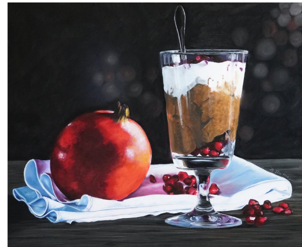
„Zeitfalte 2“, 2019