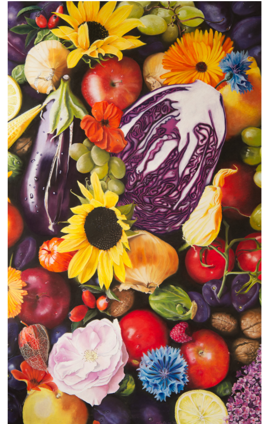
„Abundance“ Pastell auf Papier 154.5*100cm 2020