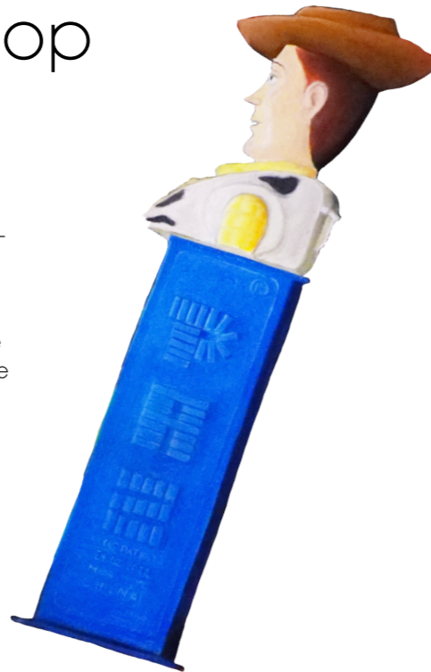
Making of „Life is no candy shop“

Ich widme dieses Bild allen Kindern in der Ukraine, die keine unbeschwertere Kindheit erleben dürfen – und deren Erinnerungen nicht süß sein werden.