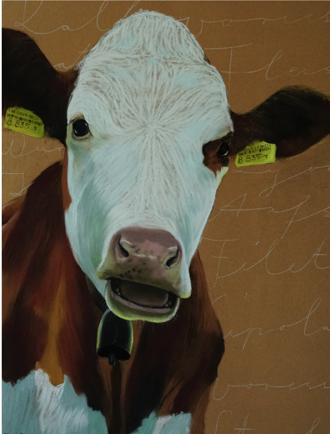
„Eat Me 4“