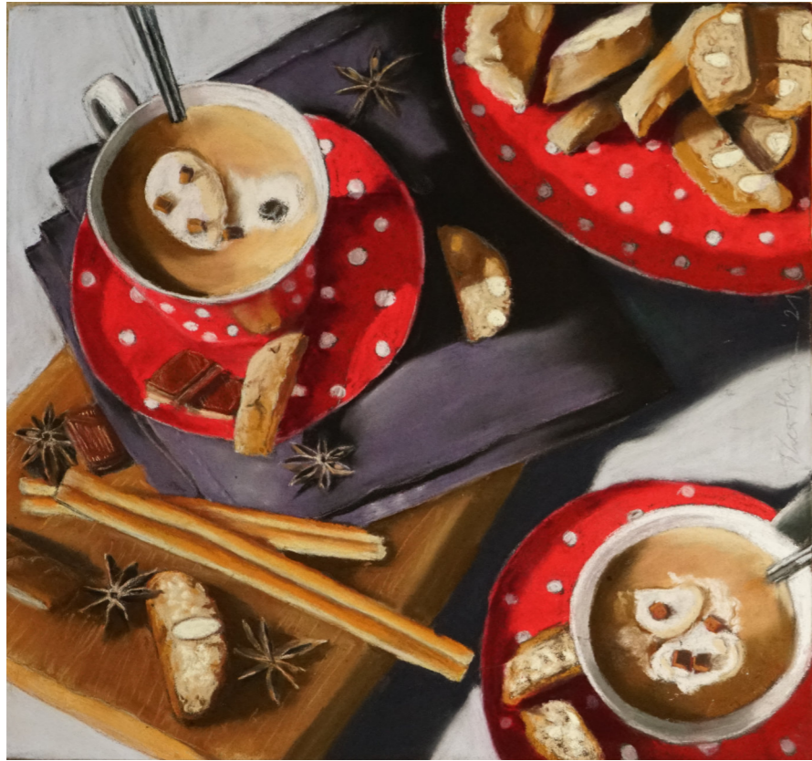
„Hot Chocolate“, 2021