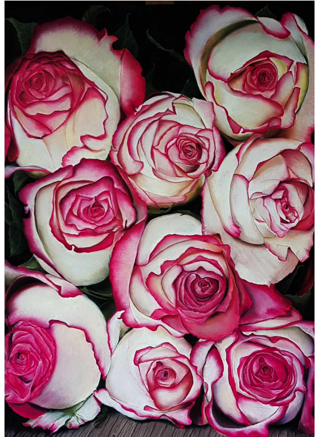
„Love in times of Corona“, 2020