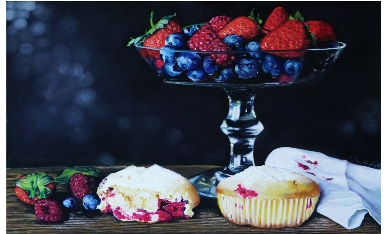
„Zeitfalte 1“, 2019

So wird das Alltägliche zum Bedeutungsträger, das Vergängliche zum Symbol. Und Essen – als Motiv wie als Praxis – zu einer Brücke zwischen Kunst, Leben und Weltgeschehen.