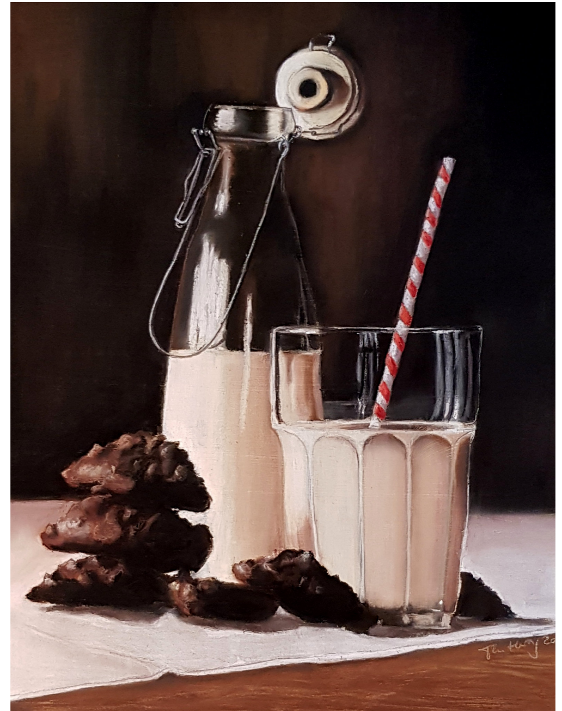
„Sweet Memories“, 2021