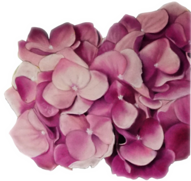
Making of „Schlussbouquet“

Diese Reise durch mein künstlerisches Universum ist für mich voller Überraschungen – und ich bin neugierig, welche Farben, Formen und Themen hinter der nächsten Biegung auf mich warten.