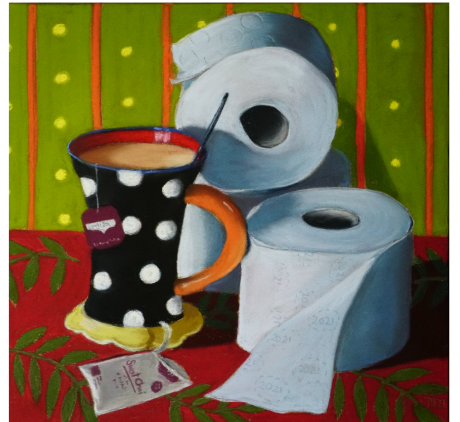
„Abwarten & Tee trinken“, 2021