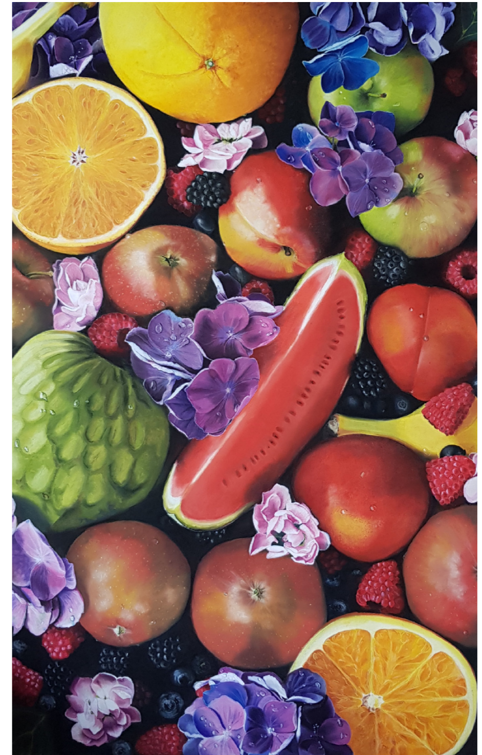
„Epiphany“ Pastell auf Papier 157*102cm 2019