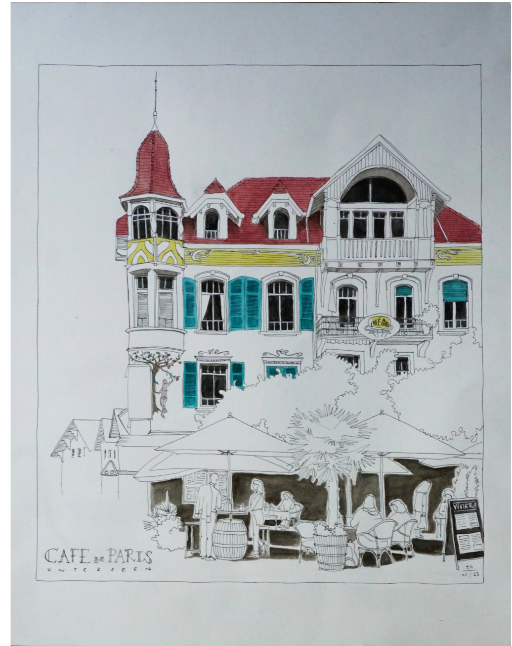
Café de Paris, Interlaken

Mit einem Schmunzeln nehme ich inzwischen zur Kenntnis, dass mich das Thema «Essen» nicht loslässt. Vielleicht habe ich mich daran schlicht «festgebissen» – und genau das macht mir Freude. Jede Skizze ist für mich nicht nur ein Bild, sondern auch eine Einladung, den Augenblick zu schmecken.